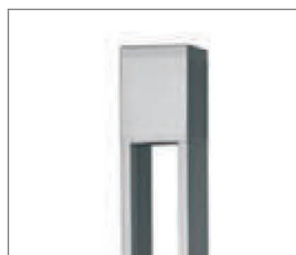
Не имеет видимых шурупов