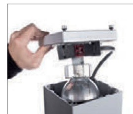
Обслуживание проводится сверху