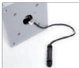
Быстрое подключение с помощью коннектора установленного в корпусе